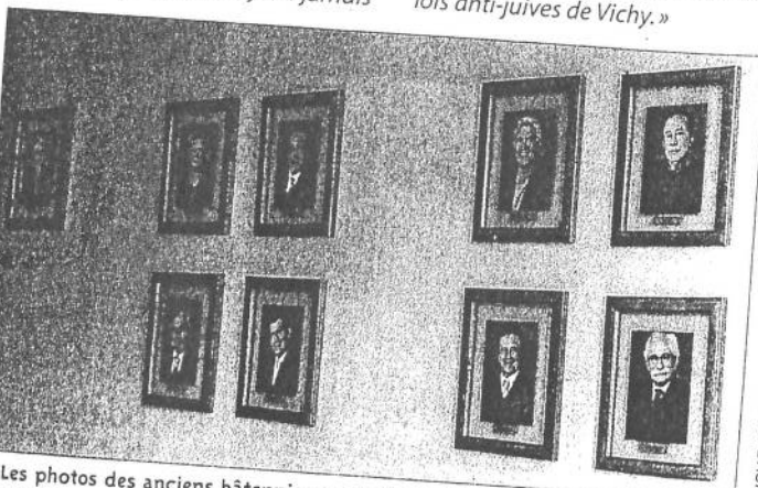
Les photos des anciens bâtonniers sont désormais affichées sur un mur de la maison de l'avocat.